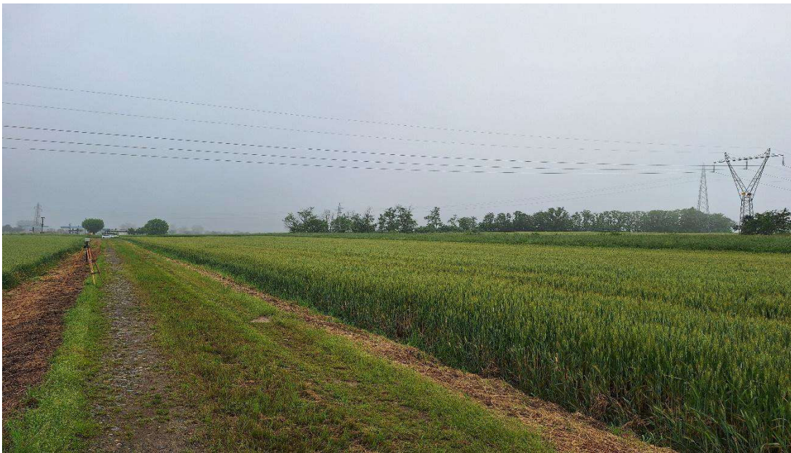
Figura 4 - foto punto di misura P1