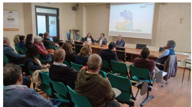
Foto evento del 9 aprile 2026 presso la sala CRED sede dell'Unione dei Comuni Amiata Grossetana