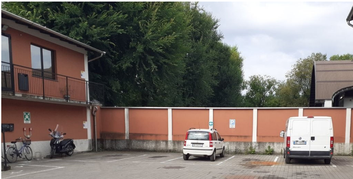
Foto 1: Vista edifici e recinzione esistente nella zona in cui verrà posizionato il nuovo blocco spogliatoio