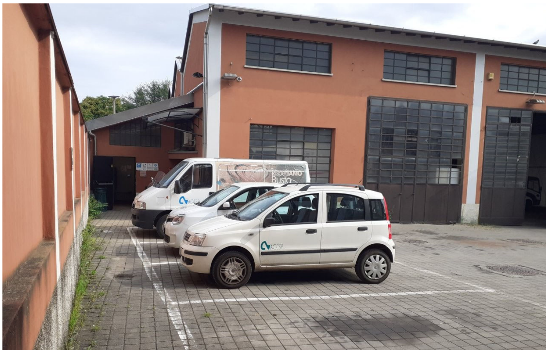
Foto 2: Ulteriore vista edifici e recinzione esistente nella zona in cui verrà posizionato il nuovo blocco spogliatoio